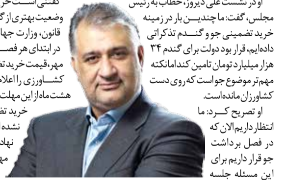
گفت و گو

گفتنی است خرید تضمینی جو هم وضعیت بهتری از گندم ندارد و طبق قانون، وزارت جهاد کشاورزی باید در ابتدای هر فصل زراعی یعنی اول مهر، قیمت خرید تضمینی محصولات کشاورزی را اعلام کند اما با گذشت هشت ماه از این مهلت قانونی هنوز قیمت خرید تضمینی جو اعلام نشده است. کمبود این نهاده به عنوان یک موقله مهم در تولید گوشت قرمز، می تواند