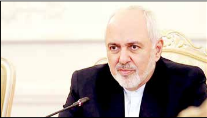
نامه سه کشور اروپایی

به گزارش ایسنا، با دستور رئیس قوه قضائیه اعزام به زندان تا تأمین وثیقه و کفالت ممنوع شد. سیدابراهیم رئیسی در جمع قضات گفت: از سراسر کشور آماری در مورد کسانیکه از یک ساعت تا دو روز در زندان بوده اند گرفتیم؛ پرسیدم چرا یک ساعت زندان، عنوان شد، قرار صادر کردم تا برود و وثیقه بیاورد. چرا باید برای یک ساعت فرد به زندان برود؟ همان جایی که قرار صادر می کنید فرد را نگه دارید تا سند یا کفالتش را بیاورد.