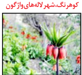
کوه رنگ، شهر لاله های واژگون

مانند آرامگاه پیر سبز چک چک، خانه تقدیری ها، کوچه ضیائی و پارک ملی سیاهکوه را نیز در لیست دیدنی های خود قرار دهید. استان سمنان کویر، جنگل، مناطق خشک و بیابانی، مناطق سرسبز را یک جامی توان در مسافتی به ابعاد ۲۰ کیلومتر مربع در استان سمنان مشاهده کرد. طبیعت بکر و دست نخورده استان سمنان به تنهایی در شهرستان های این استان نیز جالب توجه است، به طوری که با سفر به شهر سمنان و سپس به شهمیرزاد و مهدیشهر می توان تجربه دو آب و هوای متفاوت را با طی کمتر از ۲۰ کیلومتر داشت. در شهرستان شاهرود نیز که «جنگل ابر» آن زبانه زده است، می توان در مناطق رضآباد و خارتوران، طی مسیر در مناطق کویری را تجربه کرد. استان سمنان دارای بیش از هزار اثر تاریخی شناسایی شده است که ۱۷۱۸ اثر از این تعداد در فهرست آثار ملی به ثبت رسیده است. اگر مقصد سفر تان جنگل ابر باشد.