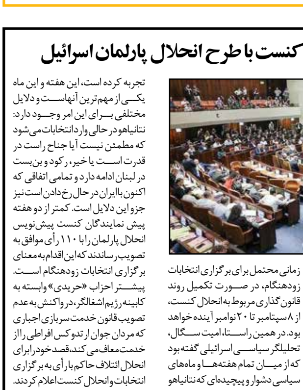
کمیسیون کنست اسرائیل صبح دیروز (دوشنبه)باطرح انحلال کنست موافقت کرد. این اقدام مقدمه‌ای برای ارائه این طرح در صحن علنی و رأی‌گیری در فرات اول به‌شمار می‌رود. به نقل از عربی ۲۱، این لایحه را رئیس‌الائتلاف و عضو کنست، اوفر کاتس، ارائه کرده است. او گفت بازه سیاسی دشوار و پیچیده‌ای که نتایجهاو

مارکو روییو، وزیر امور خارجه آمریکاطی ۴۸ ساعت گذشته در میانه حملات شدید اسرائیل به لبنان به‌غم آتش‌بس اعلامی بامیانجیگری آمریکا، تلاش‌های دیپلماتیک فشرده‌ای در جهت ارائه ابتکار جدیدی برای آتش‌بس و کاهش تنش میان لبنان و اسرائیل رهبری کرده است. ویگاه خبری-تحلیلی آکسیوس باانتشار این مطلب نوشت: منابع مطلع می‌گویند تازه‌ترین تلاش آمریکا برای آتش‌بس در لبنان در شرایطی که اسرائیل تهاجم زمینی خود را گسترش می‌دهد و به دنبال چراغ سبز آمریکا برای انجام حملات گسترده به اهداف حزب‌الله