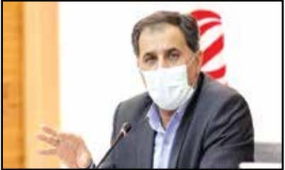
کالابرگ و کمک های معیشتی می تواند موثر باشد اما افزایش مزد کارگران باید ملموس باشد و بخشی از مشکلات معیشتی

در بخش دیگر گزارش بانک جهانی، یک دسته بندی از خانوارها در سال ۲۰۲۰ بر اساس شغلی که سرپرست خانوار دارد، ارائه شده است. طبق این آمار، ۳۸ درصد از ثروتمندترین گروه جامعه در بخش خدمات، ۱۲ درصد در بخش دولتی و ۱۰ درصد در بخش سلامت آموزش مشغول به کار هستند. تنها ۹ درصد از این خانوارها سرپرستی دارند که در بخش ساخت و ساز فعالیت می کنند. این در حالی است که کمتر از ۳ درصد از ۲۰ درصد فقیر جامعه سرپرستی شاغل در بخش دولتی یا سلامت و آموزش دارد و در مقابل ۳۱ درصد از آنها در بخش ساخت و ساز فعالیت می کنند؛ بخشی که به گفته بانک جهانی، افزایشی در درآمد حقیقی آنها در یک دهه گذشته ایجاد نشده است. همچنین، نرخ بیکاری در خانوارهای ۲۰ درصد فقیر بالاتر از ۲۰ درصد ثروتمند است. طبق مطالعات بانک جهانی، زمانی که یک گشایش اقتصادی در سال های ۲۰۱۴ و ۲۰۱۷ اتفاق افتاد، وضعیت خانوارهای نزدیک به خط فقر که در بخش کشاورزی و خدمات کاری می کردند اندکی بهبود یافت اما این بهبود در دوره بعد و زمانی که دوباره اقتصاد به سمت رکود رفت، حذف شد.