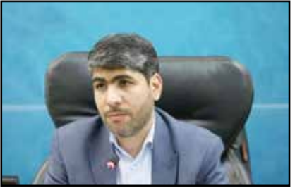
رئیس سازمان امور اداری و استخدامی کشور: نیروهای شرکتی مشکلی از نظر حقوق و دریافتی ندارند

در سال جاری جذبی خواهند داشت؟ افزود: دستگاه های دیگر مانند وزارت نفت، وزارت اقتصاد، گمرک، مالیات، برخی بانک ها، وزارت علوم، تحقیقات و فناوری، وزارت بهداشت، درمان و آموزش پزشکی جذب داشته و دارند. همچنین طرحی برای پرستاری و جذب اعضای هیات علمی و غیره نیز در سال جاری داریم.