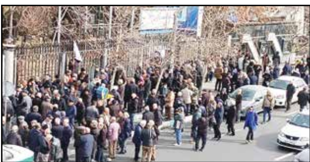
شماری از بازنشستگان شرکت هواپیمایی جمهوری اسلامی ایران (هما) روز چهارشنبه در اعتراض به آنچه تصرف غیرقانونی اموال و دارایی‌های صندوق بازنشستگی

کارگران با امضای کارزاری اینترنتی، خواستار افزایش دستمزد مطابق با هزینه سبد معیشت شدند. به گزارش ایلمنا، در متن این کارزار آمده است: در سال‌های اخیر، نوسانات ارزی، تورم و افزایش هزینه‌های زندگی، فشارهای زیادی بر دوش کارگران و خانواده‌هایشان گذاشته است. با توجه به محاسبات انجام‌شده و هزینه‌های سبد معیشت، حداقل دستمزد فعلی به هیچ