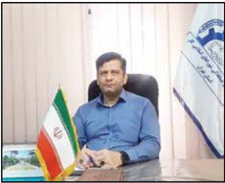
عضو کانون هماهنگی شورا‌های اسلامی کار استان تهران توضیح

این مبلغ علی‌الحساب متناسب‌سازی مراد است که به حساب بازنشستگان لشگری واریز شده است. به موجب جزء (۱) بند (ر) ماده ۲۸قانون برنامه هفتم توسعه، فقط مشتری کینی که تا پایان سال ۱۴۰۲ خدمت آنان پایان یافته است، در شمول متناسب‌سازی قرار می‌گیرند.