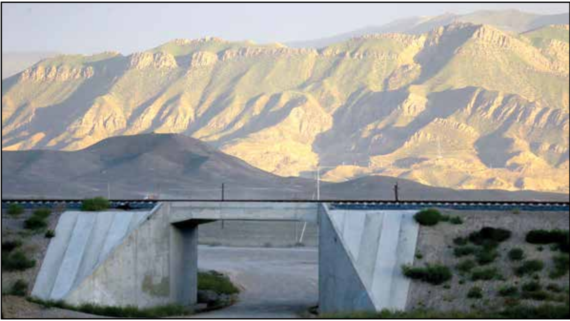
میرا قربانی فر

کریدور زنگ‌زور حالا دیگر فقط یک مسیر ارتباطی و دالان حمل‌ونقل نیست و به‌نظر می‌رسد که تبدیل به یک بهانه جدی برای وزن‌کشی و زور آزمایی در منطقه قفقاز جنوبی نیز شده‌است. زور آزمایی که حالا روسیه، ترکیه، باکو و ارمنستان در کنار ایران از اصلی‌ترین بازیگران آن هستند