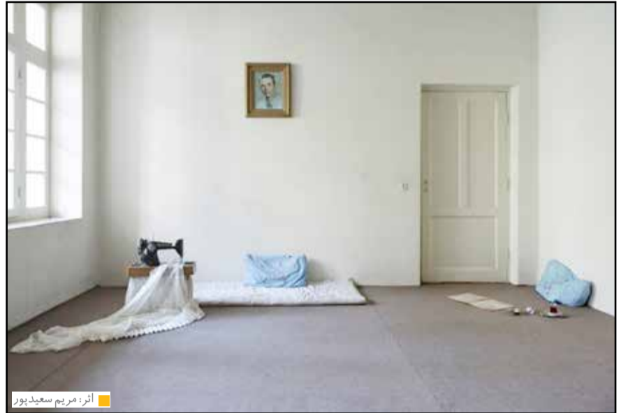
آثر: هریم سعیدپور