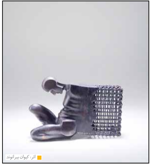
آثر: کیوان بیرانوند

سفرش دهندگان با ابعادی عمیق‌تر در زمینه فرهنگ مواجبه‌م. واقعیت این است که گسترش فضای مجازی و حجم تصویری که از طریق آن میان کاربران مبادله می‌شود سواد بصری عموم را گسترش داده و اطلاع‌رسانی تا اندازه زیادی با تصویر و طراحی گره خورده است. علیرغم اینکه در مرور پوسترهای فصل‌های گذشته نشانه‌هایی از کم‌توجهی به کارکردهای ویژه پوسترهای تئاتر در معرفی رویدادهای مرتبط با هنرهای نمایشی آشکار است، اما با رقه‌هایی از ظهور پدیده‌هایی در جهت گسترش و قدرت بخشیدن به این کارکردها هم‌اکنون سوی برخی طراحان گرافیک در این عرصه به چشم می‌خورد. اگرچه در حال حاضر ممکن است برخی از این پدیده‌ها به خودی خود ناموجه و حتی ناهنجار به نظر برسند، اما در عین حال می‌توان به تصحیح و تکامل چنین پدیده‌هایی امیدوار بود. در این مجال برخی از این پدیده‌ها را مرور می‌کنیم. یکی از رویکردهای رو به فزونی در طراحی پوسترهای نمایش اقبال طراحان به تابو گرافیک عنوان‌های نمایش‌هاست. این رویکرد که در حال حاضر نوعی ناهنجاری را در نحوه معرفی نمایش‌ها شکل داده در صورت دقت عمل بیشتر طراحان می‌تواند به یکی از عناصر سازنده پوسترهای تئاتر تبدیل شود. در این زمینه خوانا بودن و سریع‌الانتقال بودن