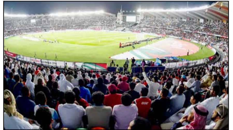
آر بار هتورد

معرفی کند. تقسیم‌بندی کشورها در این جام دشواری‌های خاص خودش را دارد. چرا که بعضی از تیم‌های بزرگ، نتایجی ضعیف‌تر از حد انتظار پشت سر گذاشته‌اند و تیم‌هایی که تا امروز صاحب فوتبال نبوده‌اند، بانمایش‌هایی منسجم و بازی‌هایی روان توانسته‌اند چشم‌ها را خیره کنند. یکی از دلایل خاص شدن این تورنمنت، حضور گسترده مربیان بزرگ و کهنه‌کار در جام است. از کارلوس کی‌روش تا پائولو بنتو گرفته تا مارچلو لیبی و اسون گوران اریکسون، نام‌های شناخته‌شده‌ای روی نیمکت تیم‌های مختلف دیده می‌شوند. در آسیا، هنوز جایی برای پیرمردا «هست» و این پیرمرداها توانسته‌اند نظم و تاکتیک را در تیم‌هایشان حاکم کنند. متوقف شدن میزبان در مسابقه افتتاحیه با نمایش خوب بحرین، اولین نتیجه‌غافلگیرکننده جام بود. در همین گروه، هند که در ۵۵ سال گذشته مسابقه‌ای را در جام ملت‌ها با پیروزی پشت سر نگذاشته بود، چهار گل به تایلند زد و مقدمات را برای اخراج سرمربی تیم حریف فراهم کرد. تایلند ناگهان با سرمربی جدید تولد دوباره‌اش را جشن گرفت و بحرین را شکست داد. هند هم با وجود ارائه یک بازی درخشان و پر موقعیت مقابل امارات، بادو گل تسلیم شد. کلاف سرد گرم