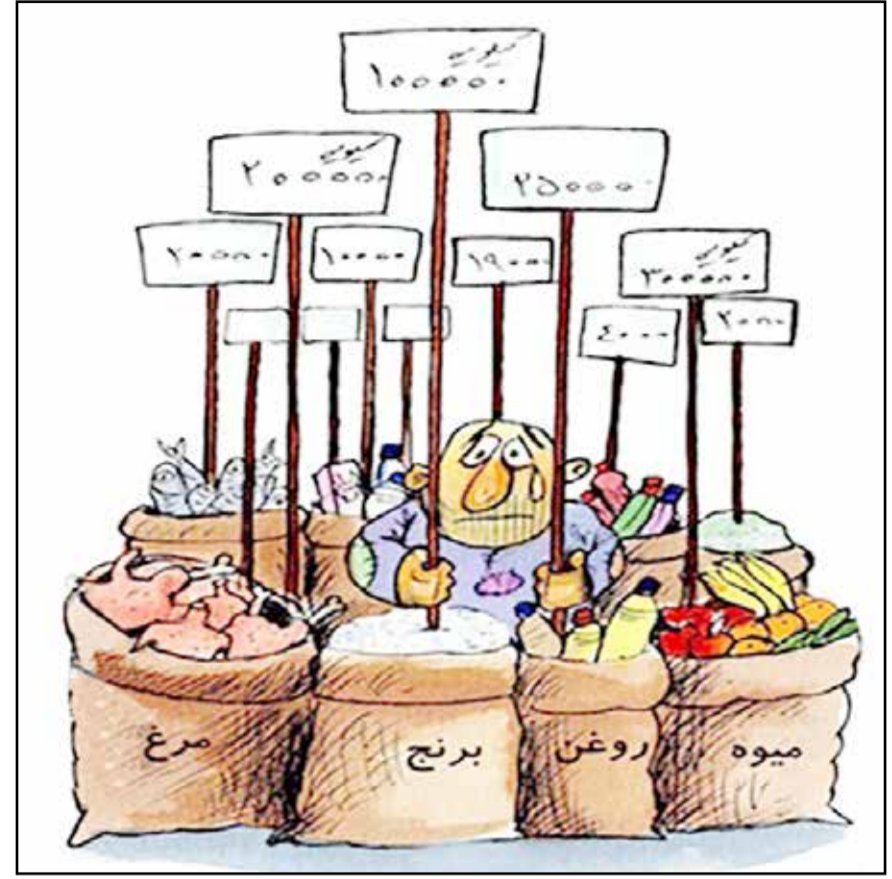
نرخ سبب هزاره مقدم

امسال گرانی هادر همه سطوح اوج گرفته و به معیشت کارگران حمله کرده است. حمل و نقل به طور متوسط ۳۰ درصد (۲۵ تا ۳۰ درصد) افزایش نرخ تاکسی در شهرهای مختلف و ۳۰ درصد افزایش بلیت مترو در تهران (گران شده و نرخ مسکن، درمان و آموزش نیز در حال افزایش یافتن است اما ملموس ترین افزایش قیمت هادر بخش خوراکی هاست که مردم، گرانی ها را هفتگی و روزانه با تمام وجود لمس می کنند. آخرین افزایش نرخ ها مربوط به