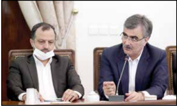
وزیر اقتصاد و رئیس بانک مرکزی

در حالی که فرزین اثر منفی سیاست انقباضی بانک مرکزی بر وام دهی بانک ها وارد کرده بود، وزیر اقتصاد نظر متفاوتی را پیرامون این موضوع مطرح کرده است. به گزارش تجارت نیوز، بانک مرکزی در ماه های اخیر سیاست انقباضی به منظور مهار رشد نقدینگی و تورم اتخاذ کرده است. گرچه آمارها نشان می دهند که اقدامات بانک مرکزی توانسته تا حدودی به تحقق این اهداف کمک کند اما همواره نگرانی هایی پیرامون اثرات جانبی این سیاست ها وجود داشته است. یکی از این اثرات نیز محدود شدن بانک ها برای اعطای وام بانکی به مردم است. این در حالیست که بانک مرکزی معتقد است که این سیاست ها به گونه ای نیستند که بانک ها را برای پرداخت تسهیلات دچار مشکل کنند اما وزیر اقتصاد در صحبت های اخیر خود، به نوعی این ادعا را رد کرده است.