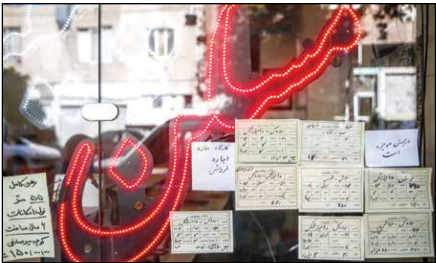
تسرین هزاره مقدم

«۹۵ درصد از اهداف محقق شده است». این جمله، بخشی از اظهارات «مهدی مسکنی» معاون تعاون وزارت کار در جمع خبرنگاران در دوم آذر ماه است. او با دفاع از عملکرد وزارت کار در حوزه تعاونی‌ها و با بیان اینکه «به‌رغم تصویری که در کشور وجود دارد، مدل تعاونی‌ها موفق است»، پنج درصد عدم توفیق خود را به تکانه‌های بازار و شرایط اقتصادی متلاطم منتسب می‌کند و می‌گوید که «این موضوع اجتناب‌ناپذیر است و البته اینها را باید با پیش‌بینی مدل‌هایی حل کرد».