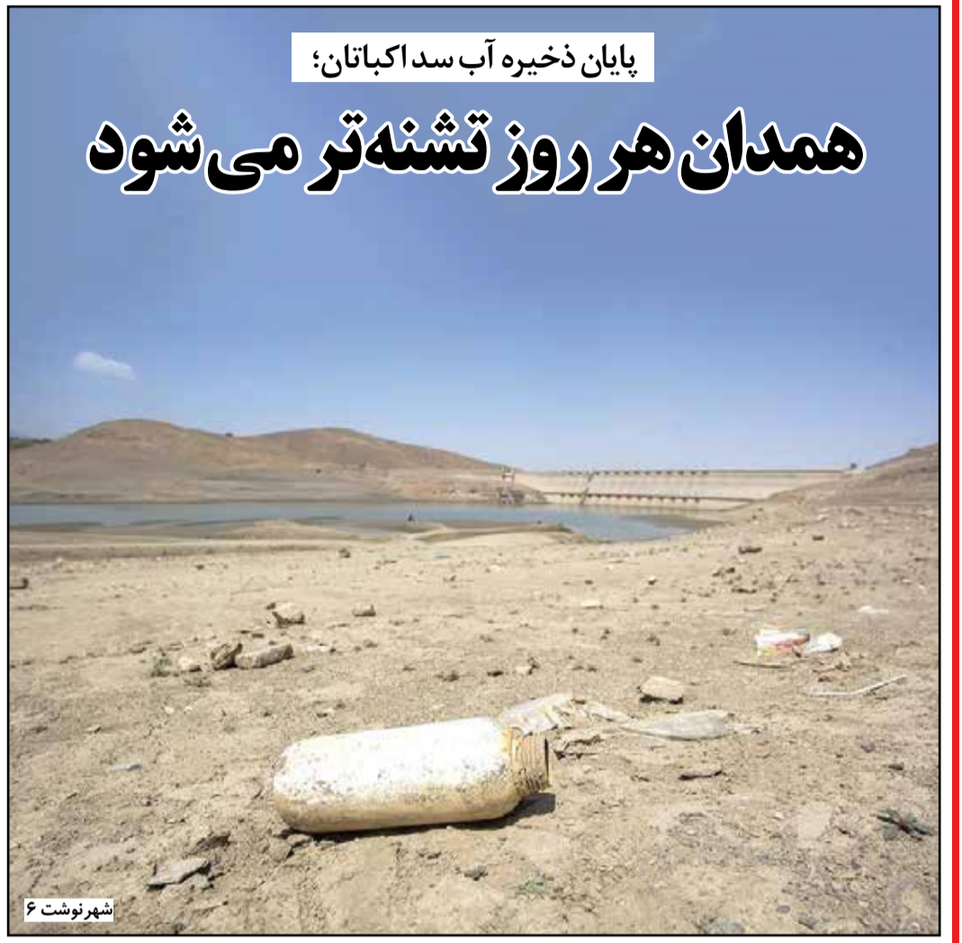
شهر نوشت ۶