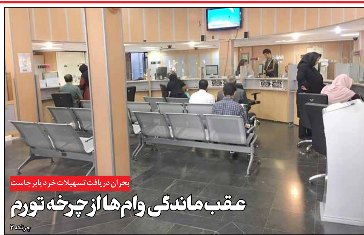
بحران دریافت تسهیلات خرد پابرجاست