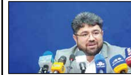
حقوق بازنشستگان تامین اجتماعی نیز گفت در پیشنهادات دولت موضوعاتی مطرح شده و باید سهم مجلس نیز در این خصوص دیده شود تا بتوان تصمیم گیری کرد.