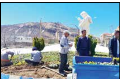
اما مشکل از آنجا آغاز شد که پول برای مخارج شهر به حساب عمرانی شهرداری واریز شده و شهردار به دنبال راه حل برای

ماه سال ۱۴۰۲ است که روز ۲۸ آذر ماه به حساب کارگران واریز شد اما ۱۴ ماه معوقات مزدی سال های ۱۴۰۰ و ۱۴۰۱ همچنان پرداخت نشده باقی مانده است. وی افزود: به رغم اینکه شهردار فعلی تمام تلاش خود را برای بهبود وضعیت مطالبات کارگران و امور اجرایی شهرداری انجام می دهد اما در زمینه تامین منابع مالی شهرداری به دلیل عدم حمایت مسئولان استانی با مشکل روبه رو است. این کارگر گفت: شهرداری از زمان زلزله سی سخت پیگیری ۸ تا ۹ میلیارد تومان طلب خود را بنیاد مسکن بود که شهردار فعلی با پیگیری های خود این پول را که بابت صدور پروانه ساخت واحدهای مسکونی از دولت طلب داشت، به یک باره و وصول کرد