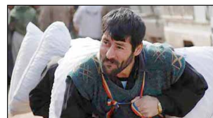
رقابتی اصلی جشنواره بین‌المللی فیلم «ترنتو» را تشکیل می‌دادند. شصت و نهمین دوره جشنواره بین‌المللی فیلم «ترنتو» که قدیمی‌ترین رویداد