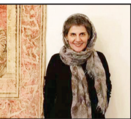
تمجوری) و «روز صفر» (سعید ملکان) را نیز در کارنامه دارد. فیروزه خسروانی نیز با فیلم «زرافکات» توانسته بود جایزه هیأت داوران بین‌المللی فیلم‌های آسیایی (آسیاتیکا) را به