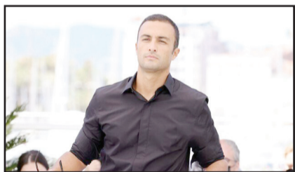
حقیقی)، «قاتل اهلی» (مسعود کیمیایی)، «پدیده (علی احمدزاده)، «هت‌تریک» (رامتین لوفی)، «تنگه ابوقریب» (بهرام توکلی)، «قانون مورفی» (رامبد جوان)، «لتیان» (علی

دست آورد. او با ساخت «هزار و یک ایران» بار دیگر توانست دو جایزه فیلم «برگزیده تماشاگران» و همچنین فیلم «برگزیده هیأت داوران» یازدهمین جشنواره بین‌المللی فیلم‌های آسیایی (آسیاتیکا) را به دست آورد.