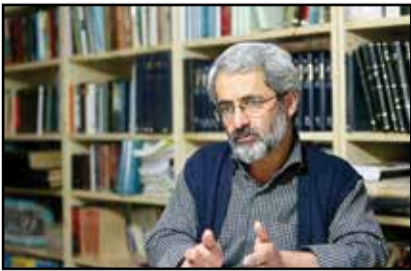
یک فعال سیاسی اصولگرا گفت: وقتی شما همه نیروهای