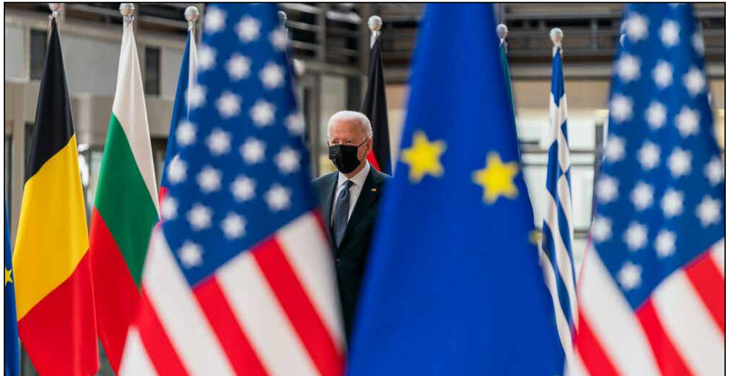
اروپا بحران مهاجران