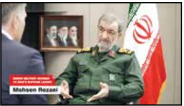
وی همچنین در پاسخ به پرسش خبرنگاری مدعی شد که به دنبال دیدار با مقام معظم رهبری نیست اما اگر این اتفاق می‌افتاد، مایه افتخار او می‌بود.

محسن رضایی در گفتگو با بی‌ان‌پا به ادعای ترامپ درباره احتمال دیدار با رهبری ایران واکنش نشان داد و گفت: آیت‌الله خامنه‌ای با ترامپ دیدار نخواهد کرد. وی همچنین در ادامه این گفتگو، مسئولیت توقف روند مذاکرات را متوجه دونالد ترامپ دانست. دونالد ترامپ در پاسخ به پرسش خبرنگاری مدعی شد که به دنبال دیدار با مقام معظم رهبری نیست اما اگر این اتفاق می‌افتاد،