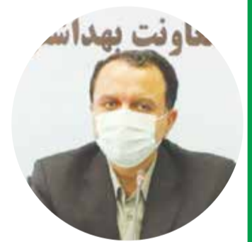
مقدمه: با توجه به برگزاری مراسم عزاداری سالار شهیدان در ایام محرم و سفر در جای ایران اسلامی عزیز و اهمیت سلامت عزاداران این را می طلبد که مدیریت کنترلی و پیشگیری به ویژه کنترل عوامل محیطی در راستای حفظ و ارتقای سلامت عزاداران با برنامه ریزی مستقیم و ملون صورت پذیرد.

ایام سوگوار سرور شهیدان حضرت ابا عبدالله الحسین (ع) را رسیده و تکایا و مساجد برای میزبانی از عزاداران حسینی رنگ و بوی محرم گرفته اند. در این ایام هر ساله جمعیت زیادی از علاقه مندان به سالار شهیدان با حضور در مساجد و دسته روی ها به عزاداری و سینه زنی می پردازند. اما با گذشت چند روزی از پایان مناسک حج و بازگشت زائران خانه خدا از کشور عربستان، موجی از بیماری های ویروسی و عفونی در اغلب مناطق کشور شایع شده است. مبتلایان به این نوع ویروس با علائمی چون تب و لرز و حالت تهوع و بی حالی همراه می باشند. بر اساس اعلام مسئولان بهداشتی استان در صورت رعایت نکردن پروتکل های بهداشتی این بیماری قابلیت سرایت بالایی دارد. در همین راستا دستور العمل های بهداشت محیط از ایام سوگوار سرور شهیدان حضرت ابا عبدالله الحسین (ع) از سوی معاون بهداشت، درمان و آموزش پزشکی به روسای دانشگاه ها و دانشکده های علوم پزشکی سراسر کشور ابلاغ شد. در این دستور العمل بر نظارت بر رعایت موازین بهداشت فردی و محیطی در مساجد، تکایا و هیأت ها و موبک ها به ویژه نظارت بر تهیه و توزیع نذورات در مراسم عزاداری برای پیشگیری از بروز بیماری های مرتبط با آب و غذا به ویژه بیماری های عفونی روده ای تأکید شده است. از طرفی عدم رعایت موازین بهداشتی در توزیع نذورات بصورت پخت غذا در مراسم عزاداری در مساجد، تکایا و هیأت ها و موبک ها می تواند احتمال بروز بیماری های مرتبط با آب و غذا به ویژه بیماری های عفونی روده ای و همچنین عدم رعایت بهداشت فردی و محیطی می تواند بیماری های مرتبط با محیط را افزایش دهد.