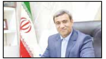
به نام خداوند جان آفرین

پیام تبریک غلامحسین مظفری به مناسبت روز ارتش