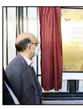
عظیمیان با اشاره به نقش آفرینی فولاد مبارکه در مبارزه با ویروس کرونا در ادامه افزود: مجموعه فعالیت‌های شرکت فولاد مبارکه برای مبارزه با بیماری کرونا در کشور بی‌نظیر است؛ شرکت تاکنون در زمینه مساعده به بیمارستان‌ها و مراکز درمانی برای خرید تجهیزات پزشکی بیش از ۱۰۰ میلیارد تومان کمک کرده، در حالی‌که هیچ

در ادامه این مراسم، دکتر سید مهدی ابطحی رئیس دانشگاه صنعتی اصفهان با بیان اینکه این همکاری از آخرین روزهای سال گذشته آغاز شده و خوشبختانه با مشارکت بسیار خوب فولاد مبارکه به نتیجه رسیده است گفت: تحریم فولاد مبارکه نشان از نقش استراتژیک این صنعت