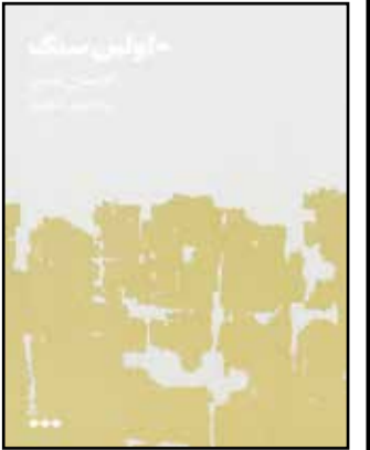
کتاب دو جلدی «اولین سنگ» نمایشی از آسیب‌های جنگ افغانستان و چگونگی

تبدیل شدن عشق و آرمانگرایی به بی‌عدالتی و تروریسم است. به گزارش ایلنا، کتاب «اولین سنگ» اثر کارستن نینسن با ترجمه وفادیری ابیکاری توسط نشر هنوز در قالب دو جلد با قیمت ۱۵۰ هزار تومان روانه بازار شده است. رمانی عظیم و طولی که سر نوشت جنگ افغانستان را از دیدگاه انسان دوستانه کارستن نینسن که یک نویسنده، روزنامه‌نگار و تحلیل‌گر دانمارکی است به نمایش می‌گذارد. این کتاب تجربه ۳۰ ساله او را