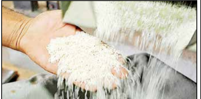
رئیس اتحادیه برنج فروشان بابل گفت: موجودی برنج‌های کشت دوم هاشمی، طارم، بی‌نام و امراللهی به کمتر از ۱۰ درصد

وزیر صمت گفت: از نظر تأمین مواد اولیه و محصولات نهایی هیچ‌گونه نگرانی نداریم و به اندازه کافی ذخایر کالایی وجود دارد، اما مهم این است که در روزهای اجرای طرح التهاب و نگرانی در بازار رخ ندهد. به گزارش «توسعه ایرانی» به نقل از وزارت صنعت، معدن و تجارت، سیدرضا فاطمی‌امین در حاشیه نشست مشترک وزیر صمت، جهاد کشاورزی و دادگستری، در مورد اصلاح روند تخصیص یارانه‌ها با اعلام اینکه ذخایر کالایی مناسبی در کشور داریم، گفت: مردم در روزهای نخست اجرای طرح بزرگ جراحی