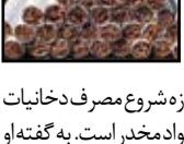
مدیر دفتر بیماری‌های غیرواگیر سازمان بهداشت جهانی گفت: تبلیغ دخانیات در هر فضای بی‌طرفانه ممنوع است.