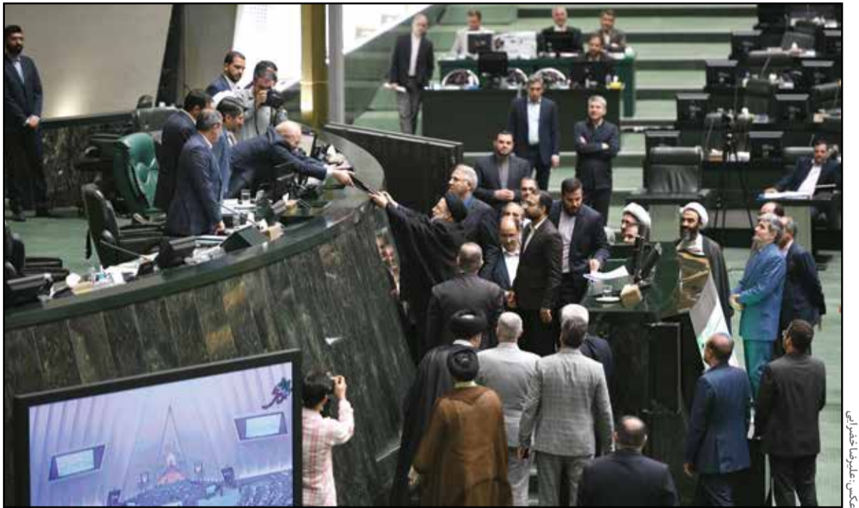
مجلس شورای اسلامی