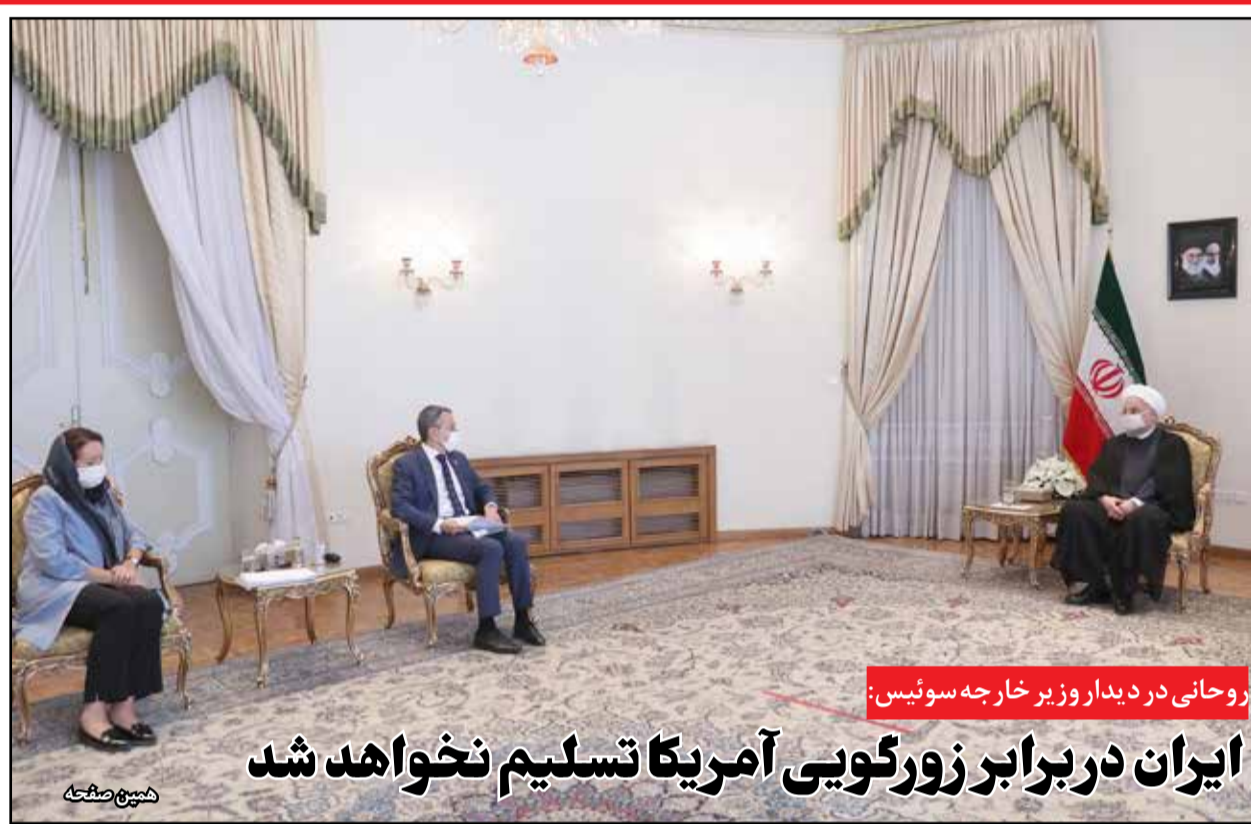
روحانی در دیدار وزیر خارجه سوئیس: