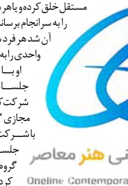
کارگاه اینترنتی هنر معاصر Online Contemporary Art Workshop