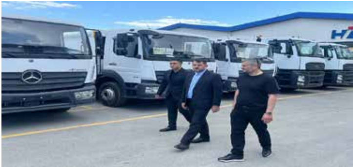
دیدار شهرداران ارومیه و شیراز با سفیر ایران در قرقیزستان در حاشیه مجمع همکاری شانگهای

خدمات بهینه به شهروندان است. برنامه ریزی‌ها و راینی های لازم جهت تقویت ناوگان حمل و نقل شهری از جمله ناوگان خدماتی، عمرانی و همینطور ناوگان حمل و نقل عمومی از جمله اتوبوس، مینی بوس و تاکسی در حال انجام است. ضرورت استفاده از ظرفیت های کارخانه HIDRO-MAK در بخش های راهسازی و توسعه ناوگان پسماند شهری امیدوارم با درایت استاندار محترم آذربایجان غربی و اعضای محترم شورای تامین بتوانیم با استفاده از ظرفیت منطقه آزاد ماکو شاهد نوسازی و بهسازی ناوگان ماشین آلات شهرداری ارومیه باشیم. مدیریت شهری بدنبال ارائه