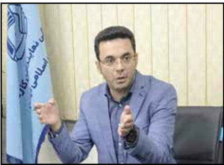
به صورت فصلی به‌روز شود. تاجیک با اشاره به آثار ارز نیمایی و انتظار تورمی برای سال آینده گفت: قیمت کالاها در

طول سال افزایش می‌یابد. زمانی که تورم به صورت پله‌ای در ماه‌ها و فصل‌های مختلف افزایش می‌یابد، دستمزد هم باید به صورت فصلی افزایش دهد. زمانی که دستمزد به صورت پلکانی افزایش یابد آثاری که از افزایش دستمزد می‌گویند، کاهش می‌یابد.