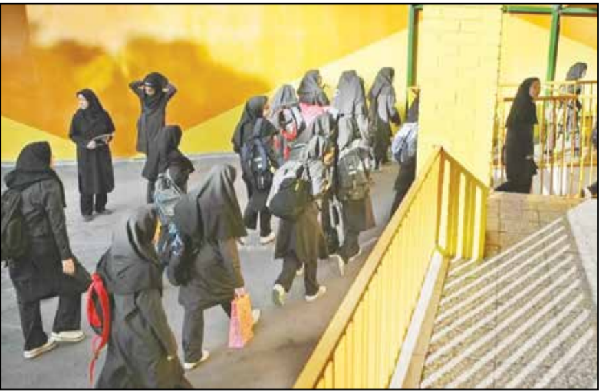
محب وبه ولی

در یک مدرسه قبل از مسمومیت دانش‌آموزان خبر دادند!