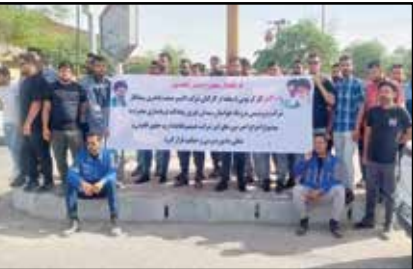
کارگران اخراجی شرکت پتروشیمی پترواند در مقابل فرمانداری بندر امام تجمع کردند.

جمعی از کارگران اخراجی شرکت پتروشیمی پترواند دیروز هم مقابل فرمانداری بندر امام و در اعتراض به تعدیل ۲۰۰ نفر از نیروهای بومی این واحد تجمع کردند. به گزارش ایلنا، این کارگران تاکید کردند: بسیاری چهارمین روز برای اعتراض به اخراج غیر عادی خود از شرکت مقابل نهادهای رسمی تجمع می کنیم.امانه مدیران شرکت نمونه مقامات شهری و آکنشی به تجمعات ندارند. از تجمع مسالمت آمیز ما مقابل درب ورودی شرکت جلوگیری می کنند و در نتیجه ناگزیر از تجمع مقابل دیگر ساختمان های اداری می شویم. این کارگران اخراجی می گویند: در پایان هفته گذشته فرمانداری بندر امام مصوبه ای را با حضور مسئولان در منطقه تنظیم کرد که طبق آن دستور بازگشت به کار ۵۰ نفر از کارگران اخراجی و لیست کردن اسامی کارگران شاغل بومی و غیر بومی برای مشخص شدن ریزیکرد پرسنلی شرکت صادر کرد اما با این حال هنوز مدیران شرکت پترواند به این مصوبه و صورت جلسه فرمانداری برای بازگشت به کار تعدادی از کارگران اخراجی که باید روز شنبه اجرایی شد، پس از چندروز عمل نکرده اند.