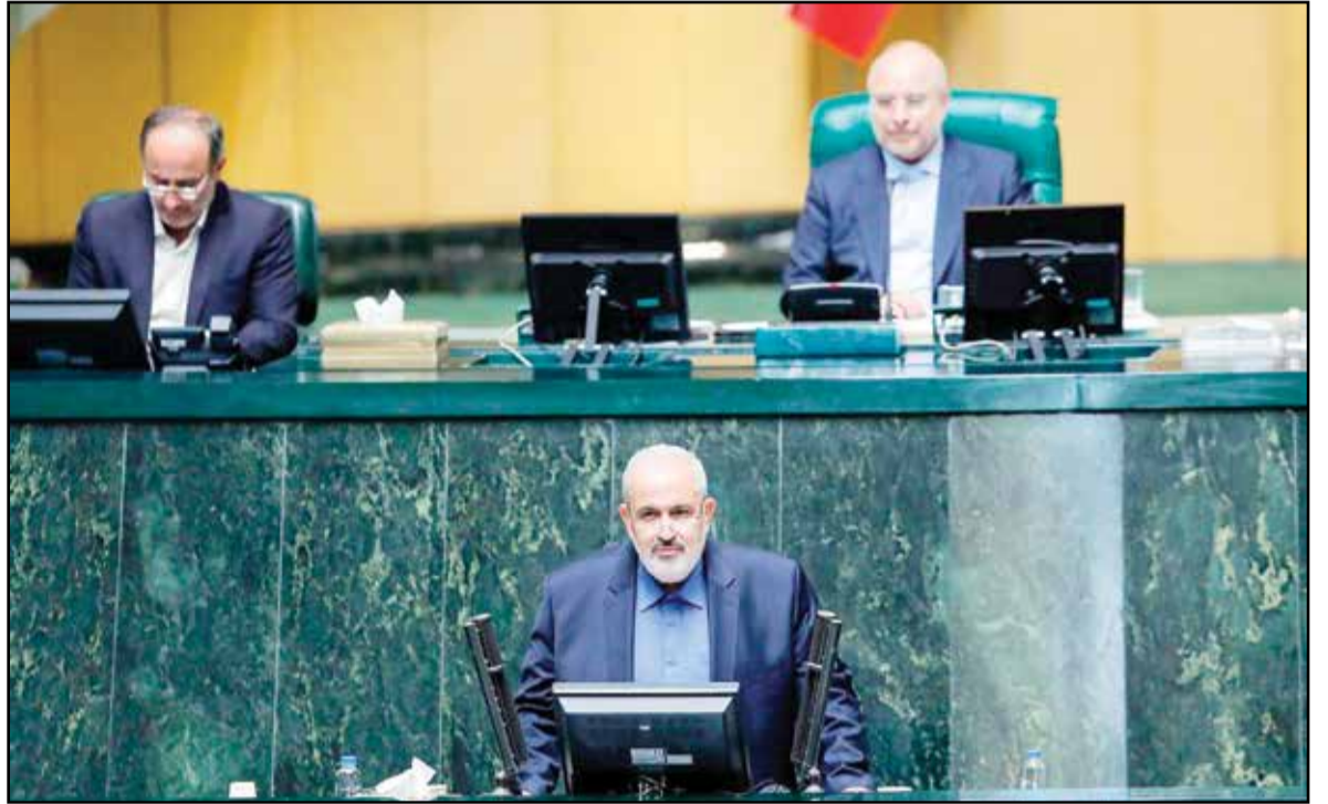
باران زرین قلم

دیروز صحن علنی مجلس شاهد اتفاقات مهمی بود. پیش از آنکه لایحه حجاب در دستور کار بررسی نمایندگان قرار گیرد، تکلیف وزارت صنعت، معدن و تجارت روشن شد. در دست وقتی که قرار است ماجرای تفکیک وزارت بازرگانی از وزارت صنعت، معدن و تجارت مورد بررسی قرار گیرد. به این ترتیب هر چند وزیر پیشنهادی صمت وعده‌های متعددی داد؛ اما باید خود را برای تعریف جدید ساختار وزارت تحت تصدیق اش مهیا کند. عباس علی‌آبادی که سال‌ها در کسوت مدیریت شرکت بزرگ مینا حضور داشته است، برنامه‌هایی را در هشت بند ارائه داد و تأکید کرد این هشت بند در برنامه‌های پیشین نبوده است.