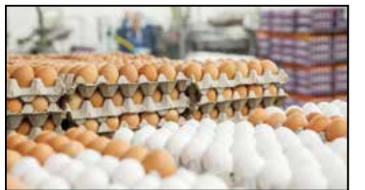
رصد بازار نشان می‌دهد در چند روز اخیر، قیمت تخم‌مرغ رشد شدیدی

را تجربه کرده است. نرخ‌های فعلی رایج در بازار، رقم واحدی نبوده و در برخی مناطق دیده شده یک شانه ۳۰ عددی تخم‌مرغ تا مرز ۱۶۰ هزار تومان نیز فروخته شده است. به گزارش اقتصاد ۲۴ نرخ مصوب اعلام شده از سوی ستاد تنظیم بازار، به ازای هر کیلو تخم‌مرغ ۴۷ هزار و ۳۰۰ تومان است. با این حال براساس اظهارات رئیس هیئت مدیره اتحادیه مرغداران میهن، هر کیلو تخم‌مرغ در ب واحدهای تولیدی ۳۶ هزار تومان فروخته می‌شود که این تفاوت نشان از ضرردهی فعالان این صنعت دارد. مرغداران بر این باورند به دلیل استفاده کمتر مردم در نیمه نخست سال از محصولات پروتئینی مانند مرغ و تخم‌مرغ، قیمت این کالاها به‌طور متوسط پایین‌تر از زمان‌های دیگر سال است. با وجود پایین اعلام شدن قیمت فروش تخم‌مرغ و گلاهی فعالان از زیان‌دهی بازار تخم‌مرغ در نیمه نخست