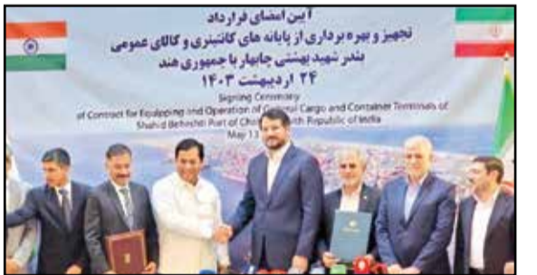
این امضای قرارداد تجهیز و بهره‌برداری از پایانه‌های کانتینری و کالاهای عمومی بندر شهید بهشتی چابهار با حضور هند ۲۴ اردیبهشت ۱۴۰۳

وزیر کشتیرانی هند نوشت: «این توافق نه تنها پیوندهای بین دو کشور بزرگ را تقویت می‌کند، بلکه گامی استوار برای هند در زنجیره تامین جهانی و بخش دریایی است.» به گزارش رسانه‌ها، به منظور تجهیز و توسعه بندر چابهار، هند ۱۲۰ میلیون دلار در تأمین تجهیزات راهبردی بندر و همچنین بیش از ۲۵۰ میلیون دلار در زیر ساخت‌های حمل و نقلی، آن سرمایه‌گذاری خواهد کرد.