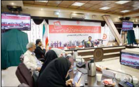
رئیس سازمان بهزیستی در نشست خبری آغاز هفته بهزیستی و سالروز تاسیس سازمان بهزیستی، خبرنگاران منتقد را مورد پرخاش قرار داد.

وی در پاسخ به خبرنگار روزنامه اعتماد که بیان کرد «دلیل حضور خانواده‌های پذیرش کننده کودکان نیازمند در مان در این جلسه رانمی‌دانم چرا که عمر فرزند خواندگی در ایران بسیار طولانی است و تاژگی ندارد و سال هاست خانواده‌ها حتی فرزندان مبتلا به اچ‌وی را پذیرش می‌کنند»، گفت: شما اجازه ندارید در جهت تئویر افکار و واقع شدن یا نشدن همکارانتان مطلبی بگویید. مگر شما مفتش هستید یا از دیگران و کالت گرفته‌اید؟ شما فقط اجازه دارید سوال رسانه خود را بپرسید. او در پاسخ به سوال خبرنگار همشهری که پرسید مستمراً ۶۵۵ هزار تومانی مددجویان در مقایسه با خط فقر ۱۵ میلیون تومانی چطور توجیه می‌شود، نیز پاسخ داد: سوال شما مرتب با حوزه اقتصاد است و روی میز اقتصاد باید پرسش شود، بنابراین آن را باید مجموعه اقتصادی کشور و معاون اقتصادی رفاهی وزارت راه جواب دهند. او به یکی دیگر از خبرنگاری که پرسید «حدود ۱۶۰ هزار موردی که اعلام کردید وارد چرخه حمایت بهزیستی شده‌اند، مربوط به تعداد افرادی است تا تعداد خانوارها»، پاسخ داد: فرقی نمی‌کند. برخی خانوارها یک نفر و برخی چند نفر هستند. مهم این است که خدمات به سرپرست خانواده پرداخت می‌شود. قادری در ادامه سه