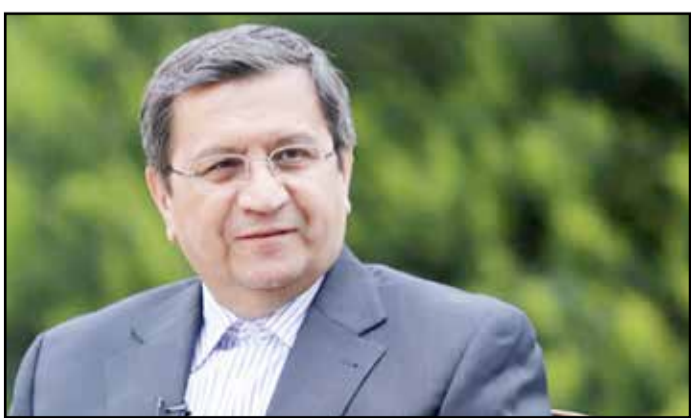
کاهش نرخ تورم و تقویت رشد اقتصادی است، به یاری خدا و یاری مردم تحقق می‌یابد.

بودجه‌ای که برای سیاست‌های اقتصادی ایران در نظر گرفته شده، به ازای هر شهروند تنها ۸۲ هزار و ۶۲۷ تومان است و در مقابل بودجه دفاعی ایران حدود ۱۰ برابر بودجه‌ای است که برای سیاست‌های اقتصادی در ایران هزینه می‌شود.