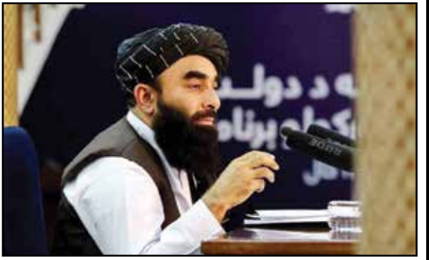
محمد شریف الله، طراح حمله به فرودگاه کابل، در جریان جلسه‌ای در پکن، ۲۰۲۴

بازداشت طراح حمله به فرودگاه کابل در پاکستان به تنشی تازه در روابط اسلام‌آباد و حکومت سرپرست طالبان در افغانستان منجر شده است. ذبیح‌الله مجاهد، سخنگوی این حکومت، در واکنش به این موضوع تأکید کرد که بازداشت این فرد (محمد شریف الله) به خاک پاکستان نشان‌دهنده وجود پناهمگاه‌های داعش در این کشور