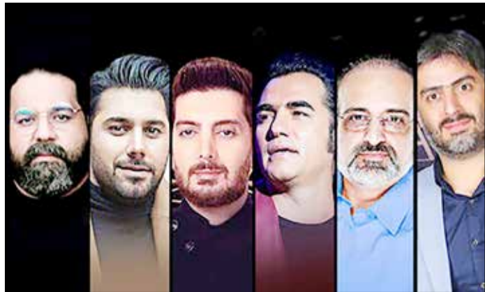
«آوای جادویی» به همراه معرفی مجری و دیگر عوامل این برنامه به زودی در اختیار رسانه‌ها و دست‌انداران موسیقی قرار خواهد گرفت.

بزرگ و یکپارچه را نداشته‌اند می‌توانند از طریق دنبال کردن صفحات رسمی این برنامه و شرکت در فراخوان‌های مربوطه که به زودی اعلام می‌گردد، وارد این مسابقه شوند. تهرانی درباره اسامی هیات مربیان و داوران منتشر شده در فضای مجازی نیز گفت: محمد اصفهانی، رضا صادقی، احسان خواجه امیری، رضا یزدانی، علیرضا افکاری و فرزاد فرزین ستارگان سرشناس موسیقی کشورمان به عنوان مربی و داور در این رویداد همراه آوای جادویی هستند. فراخوان مسابقه استعدادیابی موسیقی