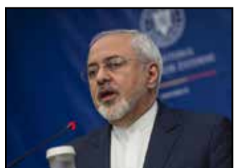
روحانی و آقای پوتین قرار شد گفت و گوهایی اینچنینی انجام شود.

ظریف تأکید کرد که روابط ایران و روسیه راهبردی است و در شرایط کنونی که تحولات عمده در سطح بین المللی در جریان است، نیاز است این گفت و گوها مرتب انجام شود و همینطور با سایر دوستان مثل چین انجام شود و این سفر با همین هدف انجام شده است. ظریف افزود: موضوعات منطقه ای و برجام از جمله موضوعات مورد بحث در این سفر است و انشاء الله نتایج خوبی داشته باشد.