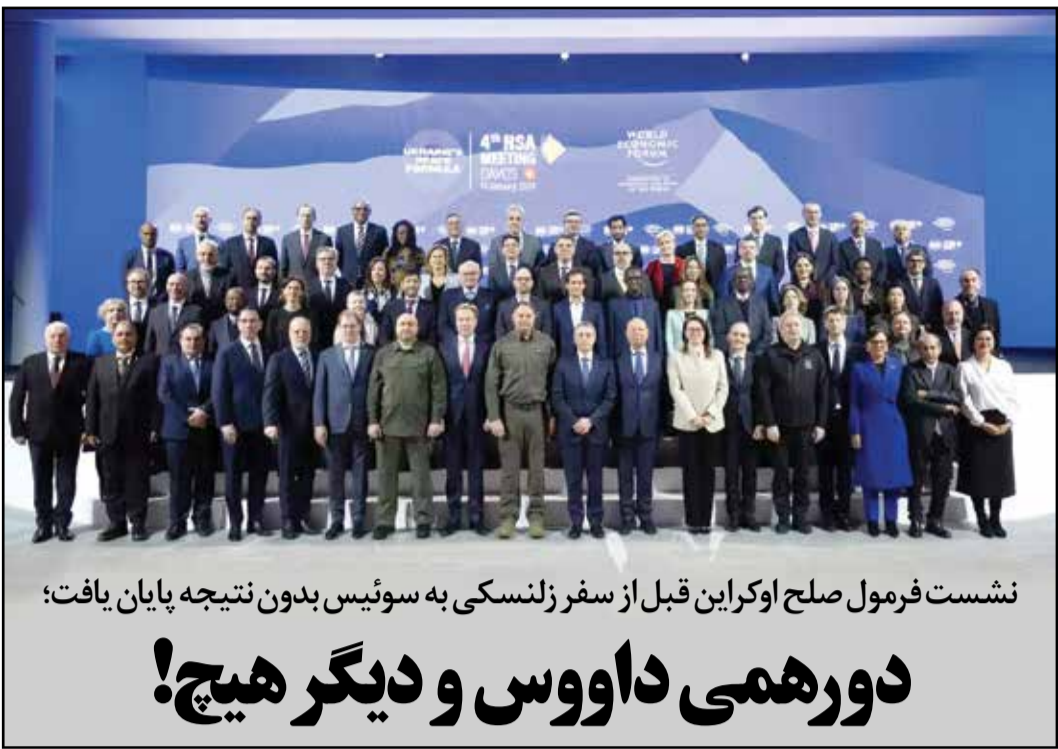
نشست فرمول صلح اوکراین قبل از سفر زلنسکی به سوئیس بدون نتیجه پایان یافت؛