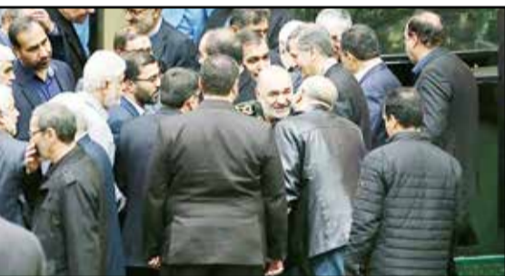
سردار سلامی در جریان جلسه غیر علنی مجلس شورای اسلامی در تهران، ۲۳ دی ۱۳۹۸.

وی همچنین دلیل سردار سلامی برای علت اعلام نشدن این حادثه در همان روز را آماده‌باش و در صحنه جنگ بودن همه فرماندهان عنوان کرد.