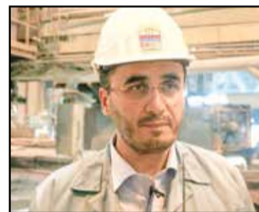
بار کمبود انرژی نیاید بر دوش صنعت فولاد باشد

عضو هیئت رئیسه مجلس تصریح کرد: نزدیکی به دریا و امکان صادرات محصول برای فولاد هرمزگان، می تواند در آینده یک افق توسعه روشن مهیا کند. البته توسعه این شرکت در آینده، نیازمند دیده شدن زیرساخت های لازم است اما در چند سال اخیر صنعت فولاد کشور با مشکل تامین انرژی مواجه شده است؛ به طوری که در تابستان محدودیت برق و در زمستان محدودیت گاز وجود دارد.