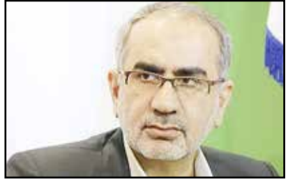
عضو کمیسیون برنامه و بودجه مجلس:

هفته در دستور کار نمایندگان مجلس قرار می‌گیرد. عضو کمیسیون برنامه، بودجه و محاسبات مجلس بیان اینکه هیچ گونه فساد در قیر یارانه‌ای متوجه نمایندگان نیست، اظهار داشت: کل مبلغ قیر یارانه‌ای چهار هزار میلیارد تومان است که از محل جابجایی طرح‌های عمرانی تامین می‌شود و قرار است این قیر در اختیار دستگاه اجرایی قرار گذاشته شود و در اختیار نمایندگان نیست که ادعای ایجاد رانت در آن باشد. قادری استقلال بودجه و اقتصاد درآمدهای نفتی را از اهداف اصلاح ساختار بودجه دانست و ادامه داد: افزایش درآمد‌های مالیاتی، کاهش وابستگی دولت به درآمدهای