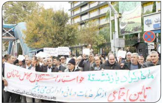
ادامه از صفحه ۶

در حال حاضر دولت در نهاد عمومی غیردولتی یعنی سازمان تامین اجتماعی که باید به صورت سه‌جانبه اداره شود، همه‌کاره است و به همین دلیل است که وضعیت سازمان براساس آمار و ارقام مناسب نیست