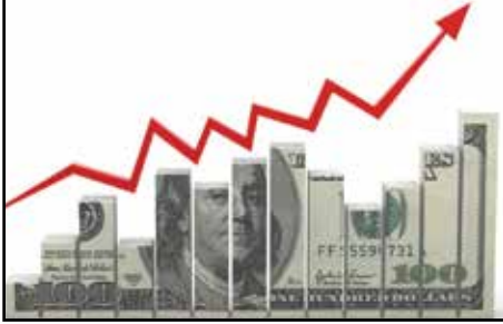
به گزارش اقتصاد۲۴، گرانی دلار چنان پلایي بر سسر اقتصاد