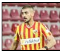
ملی به آن تمایل دارد یا خیر.

مدافع تیم کاپیسی اسپور در تابستان تبدیل به بازیکن آزاد می‌شود و شنیده‌ها حکایت از آن دارد که حسینی دوست دارد دوباره به لیگ برتر برگردد. پرسپولیس و استقلال نسبت