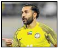
ملی به آن تمایل دارد یا خیر.

جدی برای حضور در فوتبال ایران روبه‌رو است اما آیا خودش چنین تمایلی دارد؟ سامان باید تجربه زندگی در ایران را بچشد و این مسأله‌ای است که باید دید شماره ۱۴ دوست‌داستانی تیم