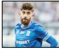
ملی به آن تمایل دارد یا خیر.

یکی از پرسروصداترین گزینه‌های نقل و انتقالات تابستانی علی قلی‌زاده است. وینگر گران قیمت تیم لیون در آخرین روزهای فصل به اوج بازگشته و کمک کرده تیمش به صدر جدول اکستر کلاسا صعود کند. آنها در صورت حفظ صدر جدول برای دو هفته دیگر، می‌توانند ضمن گرفتن جشن قهرمانی، مجوز حضور در پلی آف لیگ قهرمانان اروپا را هم به دست بیاورند. از طرفی بازیکن ملی‌پوش و تکنیکی لیون‌پوزنان با آنها قرارداد دارد و بعید است شانس حضور در چمپیونز لیگ را به این راحتی از دست بدهد. با این وجود قلی‌زاده مشتری‌بان روپاقرصی در ایران دارد که