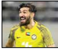
ملی به آن تمایل دارد یا خیر.

آقای گل لیگ‌های ۲۲ و ۲۳ فوتبال ایران مجدداً در تابستان گذشته لیونر شد و این بار در فوتبال امارات رفت تالیاس اتحاد کلبا را بر تن کند. شهریار نتوانست انتظارات را برآورده کند و خودش هم از شرایطش چندان راضی نیست و دوست دارد در سال منتهی به جام جهانی، در چشم‌پاشد و جاگاهش در لیست تیم امیر قلعه‌نویی را از دست ندهد. او با وجود این که یک سال با بیرها قرار داد دارد، نسبت به بازگشت پالس مثبت فرستاده است.