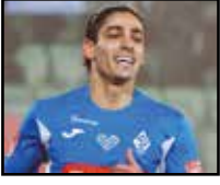
ملی به آن تمایل دارد یا خیر.