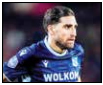
ملی به آن تمایل دارد یا خیر.

و نهایتاً کاپیتان فعلی تیم ملی ایران، علیرضا جهانبخش. او دوباره مصدوم نشد و روزهای پایانی فصل را از دست داد. علی جهسان دیگر سایر نفرین قرارداد ندارد و گویا قرار نیست همکاری بین آنها ادامه داشته باشد. همین قضیه باعث شده تا گمانه‌زنی‌هایی مبنی بر بازگشت به گوش برسد. پرسپولیس که چندین سال قبل تا به خدمت گرفتن بازیکن وقت داماش فاصله‌ای نداشت، بار دیگر قصد دارد برای استخدامش تلاش کند. با این حال شنیده می‌شود جهانبخش همچنان دوست دارد به بازی در خارج از ایران ادامه دهد.