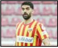
ملی به آن تمایل دارد یا خیر.

هافبک خوش فکر تیم کاپیسی اسپور از مهره‌های اصلی این تیم در میانه میدان به حساب می‌آید اما شاید توسط استقلال و سپاهان دنبال می‌شود تا در صورت مهیا بودن شرایط به لیگ برتر ایران بازگردد. دو سال از قرارداد باقی مانده است اما با توجه به سن و سالش و طلبی که از کاپیسی دارد، بعید نیست طرفین به توافقاتی با یکدیگر برسند. در شرایطی که علی دغدغه‌ای بابت رضایت‌نامه نداشته باشد، رقابت سختی بین استقلال و سپاهان بر سر جذبش به راه خواهد افتاد.